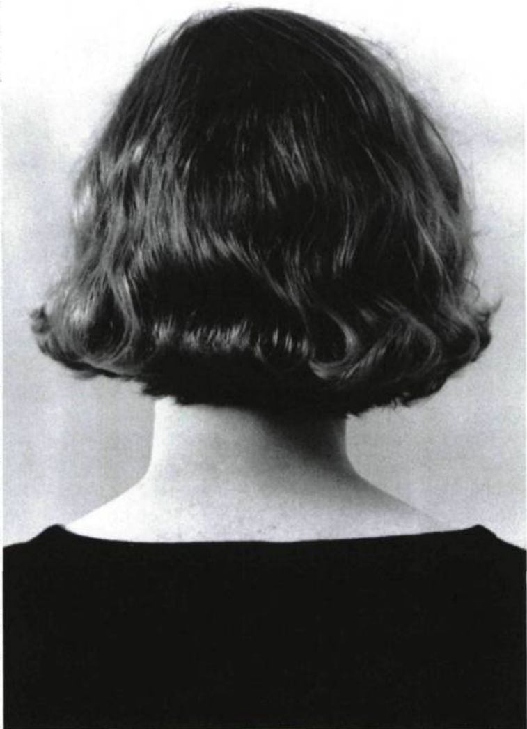
Jeanne Dunning, Head 9 , 1990. Cibachrome laminé sur plexiglass ; 72 cm x 48 cm.

C'est de cette situation de fausse intimité, de ce paradoxe, que vient sans doute l'impression de malaise du spectateur. Dans cette même série, comme dans beaucoup de ses autres travaux, Jeanne Dunning parle du fragment et du rapport à l'image du corps, utilisant toute l'ambiguïté de l'élément isolé qui prend de ce fait une dimension emblématique de fétiche ou de totem. Passé le stade de la frustration du spectateur, privé de regard ; son approche de l'image pose la question de la relation du fragment au tout et de l'individu à une société de masse.