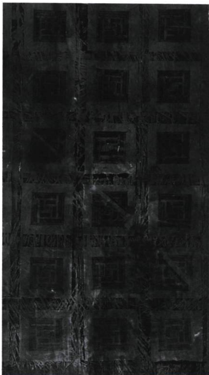
Phoenix Varbanov, sans titre, 1991 ; de même que la page précédente.

compromis. Car dans cette juste mesure, il exprime plutôt le souci d'user d'un répertoire de formes susceptibles de toucher les sensibilités collectives, universelles. Ainsi, la figure du cercle, maintes fois répétée, possède-t-elle une symbolique forte en Orient et en Occident ? : image du ciel, de l'éternité, image planétaire ou cosmique... Peu tenté par les images emblématiques que l'Occident attend bien souvent des artistes chinois, et pas plus attiré par l'esthétique modélisée des grands courants artistiques internationaux, Phoenix Varbanov persiste dans ses choix.