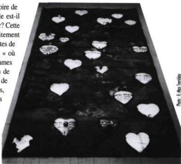
Une œuvre de Peter Krausz.

Maintenir vivante et douloureuse la mémoire de l'horreur et le souvenir de l'impensable est-il suffisant à en prévenir à jamais le retour? Cette question n'est jamais formulée explicitement dans les deux belles expositions conjointes de Peter Krausz. Mais si l'oubli est bien ce lieu « où sont déposés les éléments de ce que nous sommes sans le savoir encore », la hantise du contenu de cet oubli, la douleur à l'idée que la possibilité de l'horrible habite peut-être chacun d'entre nous, sont implicites dans toute sa production. On les pressent dans la matière des 250 plaques-mémoires disposées sur les murs de la Galerie Samuel Lallouz. Sur chacune d'elles, un nom de ville de France et une date, un lieu et un