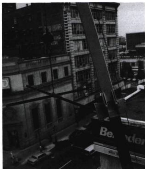
André Fournelle, Resecare , 1990. Détail de la structure.

André Fournelle, L'interdit damoclèse , Galerie Frédéric Palardy, Montréal. Du 12 août au 5 septembre 1992