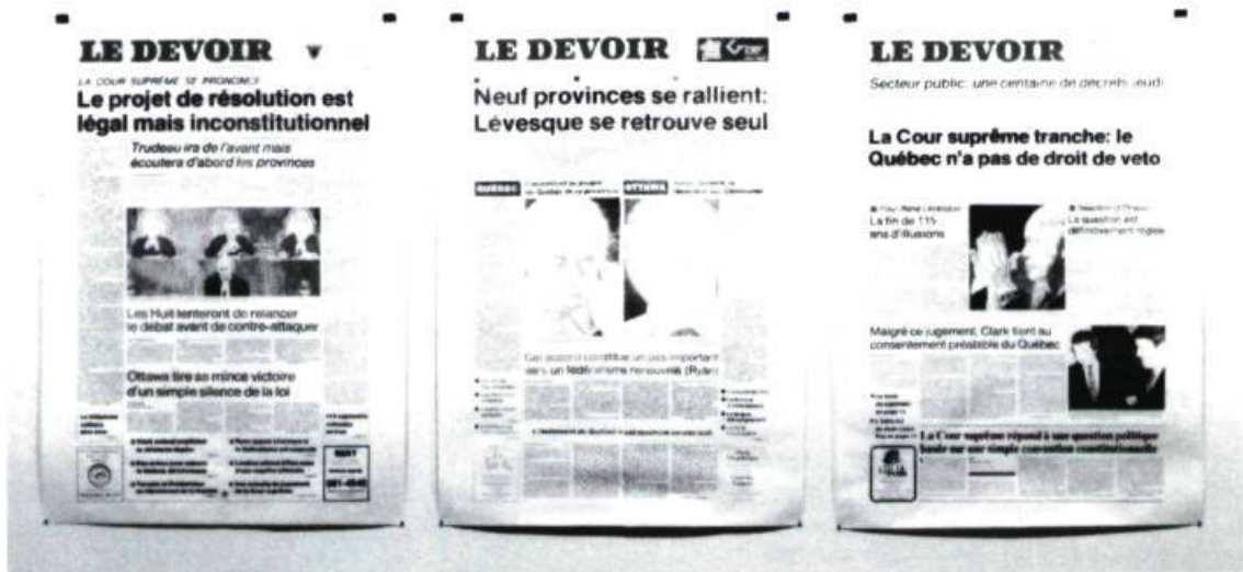
Daniel Jean, Pages d'histoire et autres faits divers , 1992. Techniques mixtes.

Daniel Jean, Pages d'histoires et autres faits divers. , Galerie Langage Plus, Alma. Du 16 au 26 octobre 1992