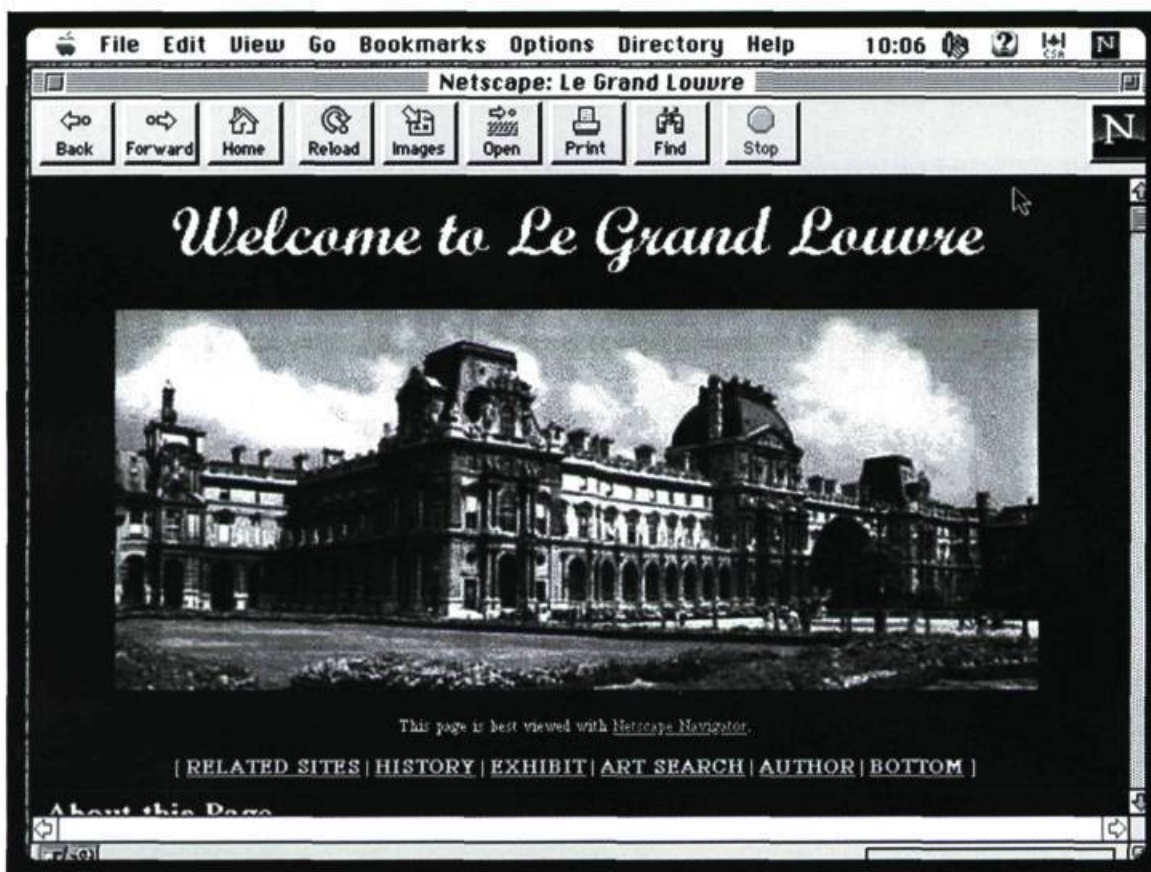
Le Grand Louvre sur Internet

maîtrise du développement culturel dans les espaces nationaux n'est qu'un discours de désarmement de la pensée, de désappropriation par les peuples et les nations de leur culture, de leur identité, de leur imaginaire, de leurs possibilités d'accéder au développement culturel et au statut de citoyen-monde légitime dont la contribution est nécessaire au devenir mondial. Tous les lecteurs auront bien sûr compris qu'il s'agit là d'une situation souhaitable, mais dont l'actualisation est pour le moins problématique, compte tenu de l'inégalité des pouvoirs qui structure actuellement les rapports internationaux, non seulement entre les peuples, nations et régions du monde, mais aussi entre les individus, selon leur provenance. La prise de conscience de cette inégalité et de l'illégitimité sociohistorique de cette situation pourrait constituer, il faut l'espérer, un premier pas vers la redéfinition des rapports arts-monde dont nous avons parlé plus haut.