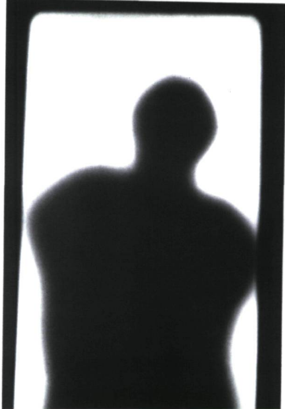
Eugénie Robitaille, Images vécues de l'oubli , 1996. Photographie en noir et blanc.

et une sélection plutôt audacieuse de l'art actuel montréalais, que l'on peut qualifier de complémentaire, par les deux commissaires Marie-Michèle Cron et David Liss.