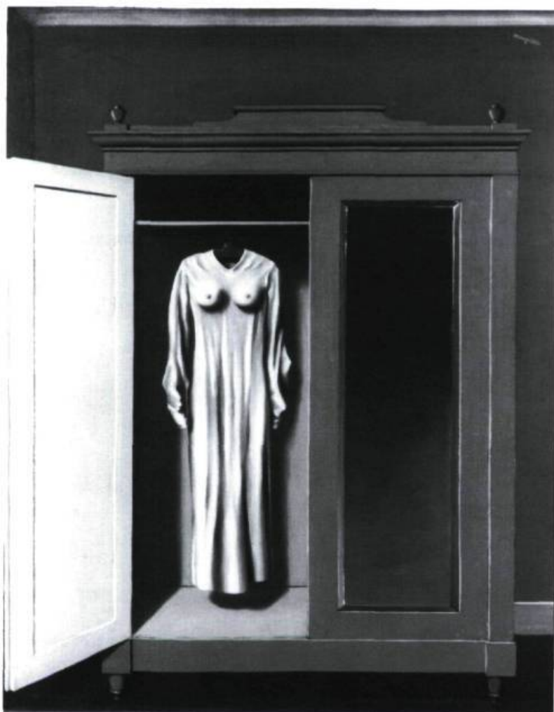
René Magritte, In memoriam Mack Sennett , 1936. Huile sur toile; 73 x 55 cm. Ville de La Louvière (Belgique).

avec la notion de « représentation », au sens où l'entendait jusqu'au début de ce siècle l'histoire de l'art : la mimesis est pour lui un faux problème, l'apport de Freud ayant démontré la valeur déjà toute fictive qu'il y a à « se représenter ». Magritte présente, plus qu'il ne représente.