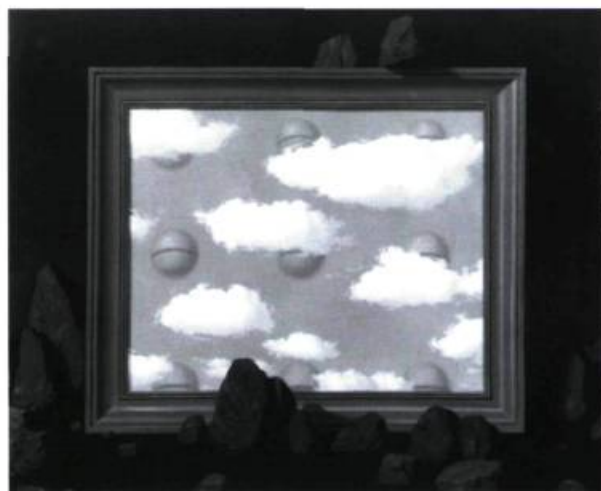
René Magritte, La grande marée , 1951. Huile sur toile; 65 x 80 cm. Collection particulière, Bruxelles. © René Magritte/Charly Herscovici, Kinémage, 1996.

Magritte pense, comme il le dit lui-même, en images, il se fait à la fois poète et voyant. Le pictural est forcément dans la poésie et la poésie, lorsqu'elle est transcrite, du moins par sa calligraphie, tisse son fil interrompu de silence, de