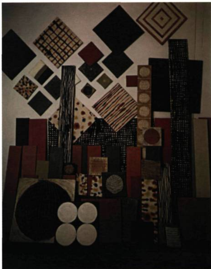
Vue partielle de l'exposition Demande à la peinture , de Marie-Claude Bouthillier, présentée à la Galerie Trois Points, Montréal.

Bouthillier a littéralement rempli à ras bord la Galerie Trois Points : c'est une orgie de tableaux disposés de presque toutes les manières que l'on puisse imaginer. L'artiste dit ne pas avoir voulu se limiter à seulement quelques unes des possibilités infinies que lui offre le matériau pictural. Elle a donc opté pour un éventail de textures et de formes : des monochromes; des surfaces sillonnées à l'encaustique avec un instrument balinaï, le tjanting ; des champs colorés avec du pigment imbibé dans la toile (à la Rothko); et aussi des tableaux avec des figures. Visuellement, il y a une telle liberté dans les assemblages de textures, de formats et de dispositions de tableaux que l'on a même parfois l'impression que Bouthillier a inventé pour la peinture de nouveaux usages.