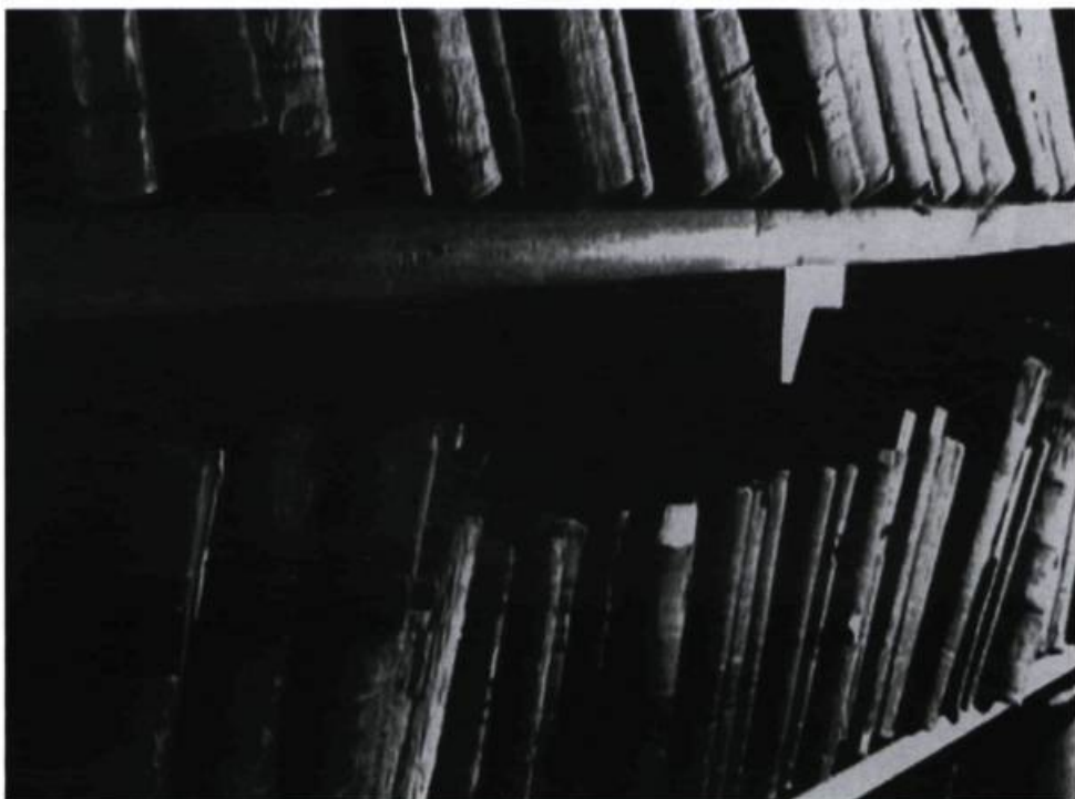
Marc Fournel, Rangées de livres , 1999.

Marc Fournel, Le puits , installation, Galerie d'Ottawa, Ottawa. Du 10 décembre 1998 au 14 février 1999