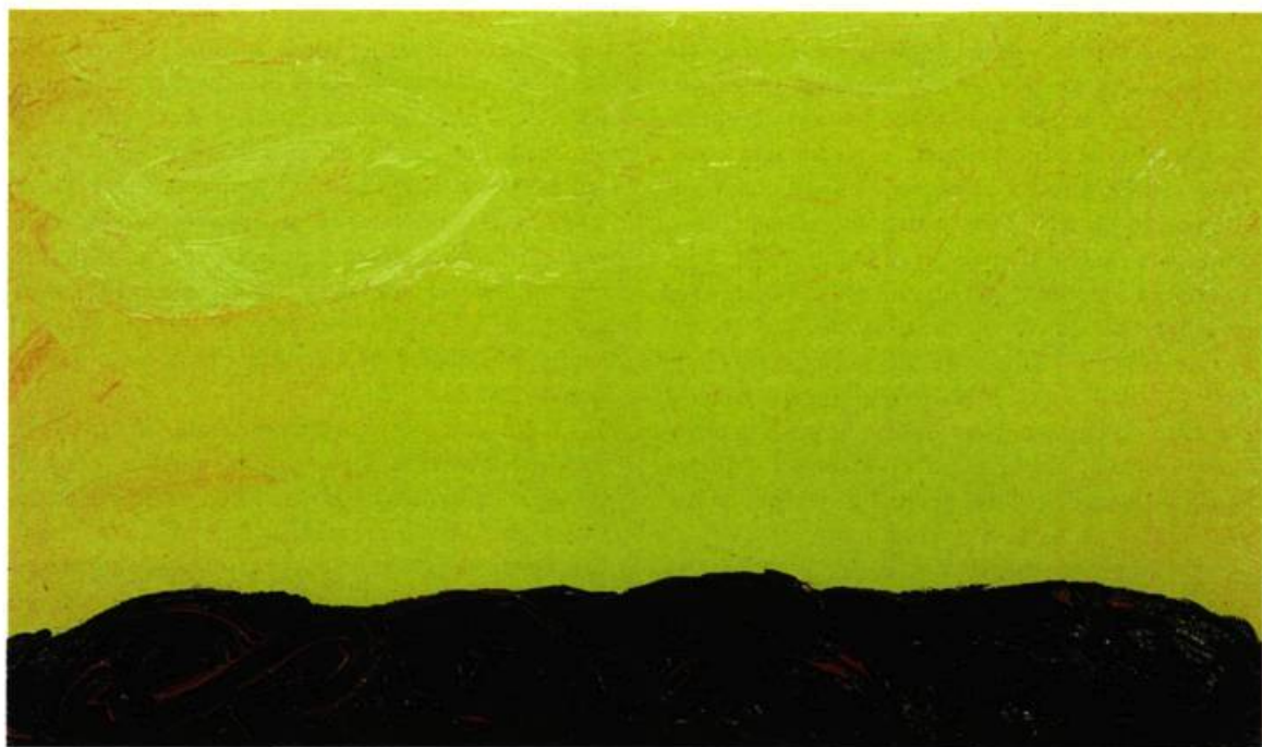
Christiane Ainsley, La colère , 1999. Acrylique sur toile; 93 x 153 cm.