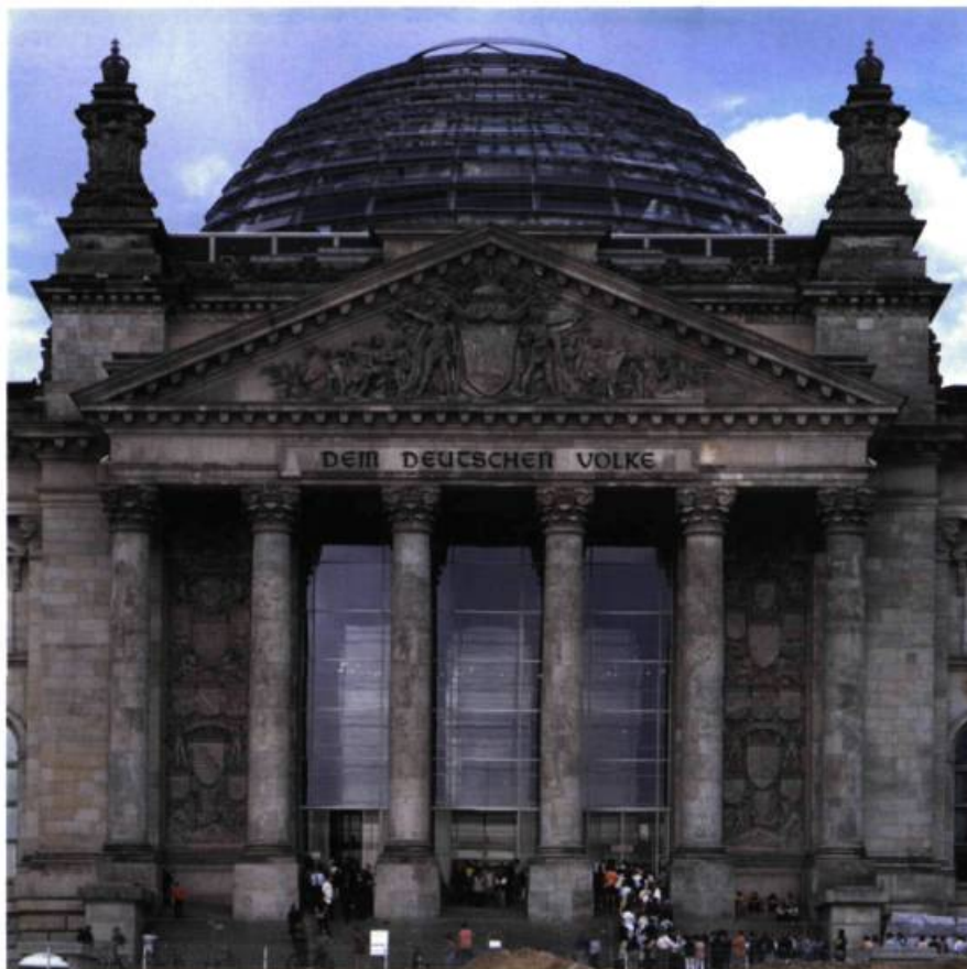
Dem deutschen Volk [Au peuple allemand], 1916. Inscription en bronze. Fronton du Reichstag, Berlin.

décider de sa réalisation 7 . Haacke proposait de construire un rectangle de 20,8 sur 6,8 mètres dans lequel chaque député (669) devra déposer le contenu de deux sacs de terre provenant de sa circonscription électorale. Au centre, écrit en lettres de néon, Der Bevölkerung (À la population), répondrait à l'inscription coulée en bronze en 1916 qui orne le fronton du Reichstag : Dem deutschen Volk (Au peuple allemand), devise évoquant encore l'idée de l'unité allemande née des guerres de libération. La croissance libre des plantes et mauvaises herbes observées par une caméra serait consultable par le citoyen sur Internet 8 , tandis qu'aux étages du bâtiment des tableaux indiqueraient : « qui » contribua à l'œuvre, « quand » et « où ». Work in Progress , l'œuvre devra être entièrement renouvelée lors du changement de législature, offrant ainsi une traduction visuelle et symbolique du territoire politique allemand, susceptible de susciter une réflexion sur le monde et les mécanismes de la démocratie.