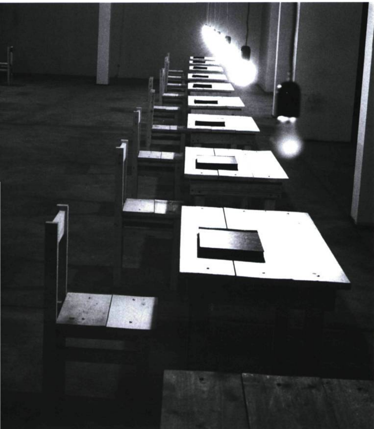
Jochen Gerz, Exit : Materialien zum Dachau-Projekt .

croix gammée comme symbole de la reconstruction de la république fédérale d'après-guerre et de son hégémonie économique après la réunification. À l'intérieur du pavillon, « Germania », écrit en grand sur le mur, faisait face à un sol détruit, résumé brutal de l'histoire du pays illustrant à merveille le titre de cette installation Bodenlos (« Sans sol »). Quant à Gerz, il créa plusieurs monuments invisibles, s'attachant ainsi à révéler la complexité du genre 14 . À Berlin, ces deux artistes ont pu poursuivre leur réflexion sur l'amnésie du monument, dont la mémoire est réactivée par l'intrusion d'une actualité – dans ce cas, le dépôt de 50 kilos de terre et une minute d'entrevue. Ils réussirent ainsi à impliquer les acteurs du lieu dans une réflexion