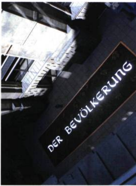
Hans Haacke, Der Bevölkerung , œuvre intégrée à la cour intérieure nord du Reichstag, Berlin, 2000. Simulation.