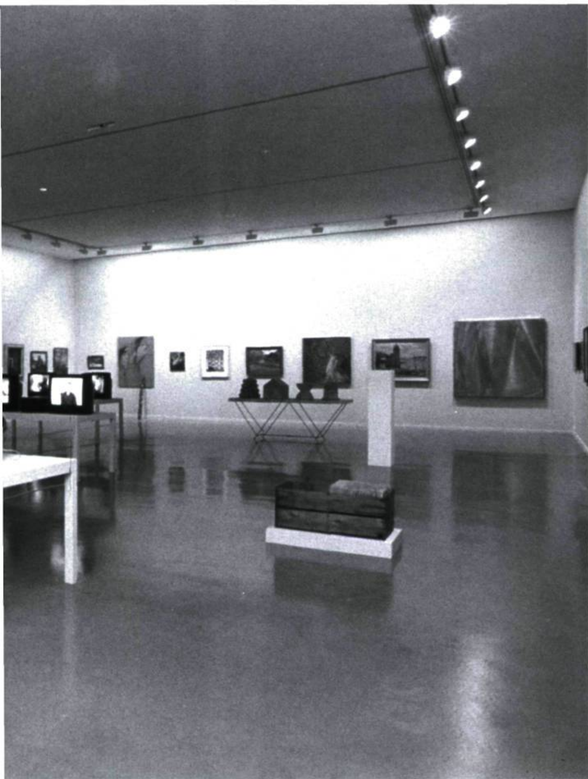
Bertrand Lavier, La peinture de Martin 1900-2000 , 2000.

portraits n/b de Keïta (aucun n'est au même niveau) rappelle certaines œuvres de Boltanski. Mais voilà que je parle à nouveau de la graphie de l'exposition et non du contenu. Et pourtant, si je me suis attardé à Sichtbare Welt (Le monde visible) de Peter Fischli et David Weiss, c'est justement parce que cette série photographique est présentée de manière originale. Comment ne pas être attiré par 14 tables lumineuses