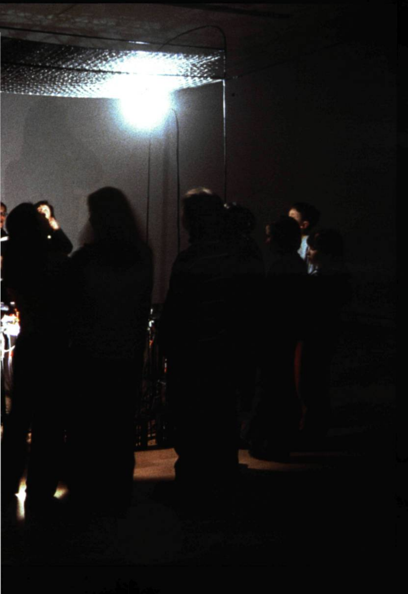
Diane Landry, Les sédentaires clandestins , 2001. Installation lumineuse et sonore.