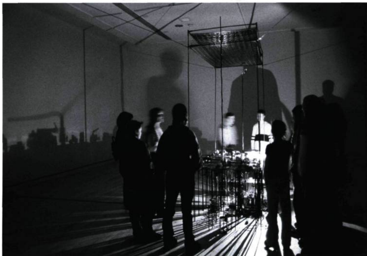
Diane Landry, les sédentaires clandestins , 2001. Installation lumineuse et sonore.

blancs, comme autant d'écrans sur lesquels se découpent les ombres issues de ce qui s'avère un appareil complexe de projection. La salle elle-même est dans le noir, alors que l'étrange automate – à l'allure d'un lit à baldaquin – s'active.