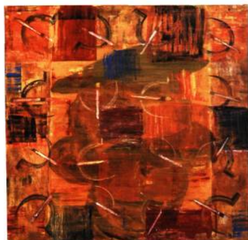
Bernard Gamoy, Le peintre face à l'Inquisition , 2003.