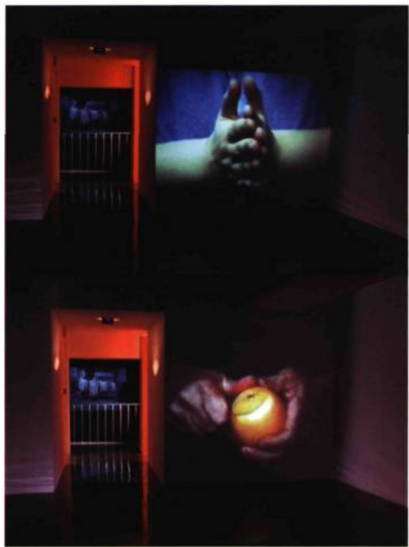
Natacha Nisic, Haus/raus- aus . Le catalogue de gestes, œuvre vidéo depuis 1994 (détail).

de vie fantomatique, cet hors champ humain invisible qui les creuse.