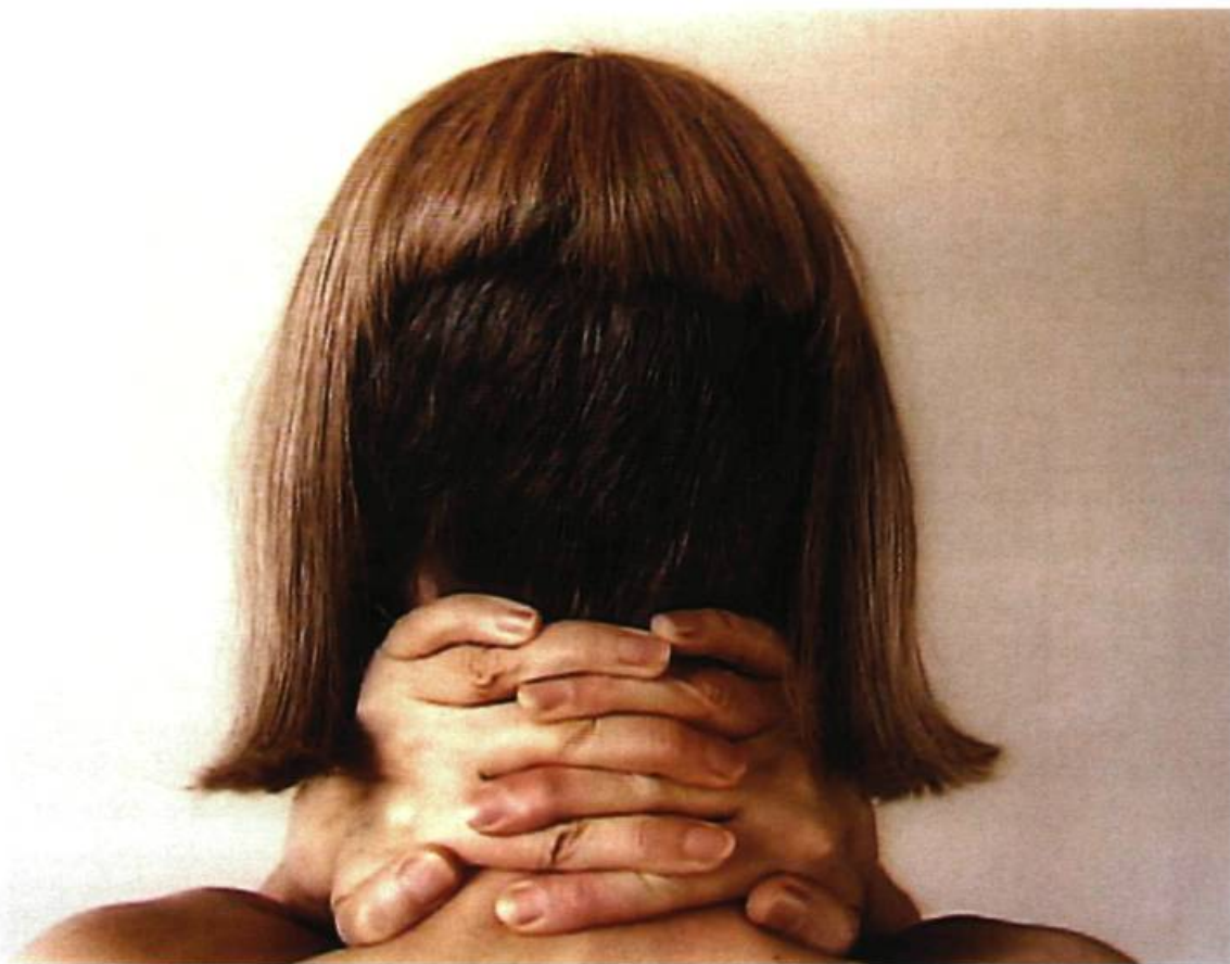
Chantal duPont, Du front tout le tour de la tête, S'envirager , 2000.

ont souvent rapproché leur propre portrait du Memento Mori , créant un lien très fort entre ces deux genres picturaux historiques que sont l'autoportrait et la vanitas . En effet, tous ces tableaux intitulés « autoportrait au crâne », très fréquents dans la peinture du XVII e siècle, offrent un bel exemple de cette rencontre entre autoportrait et vanité 15 . Car le « moi » de l'artiste « ne se découvre dans sa vérité singulière qu'en s'anéantissant », comme l'avait bien démontré Louis Marin. 16