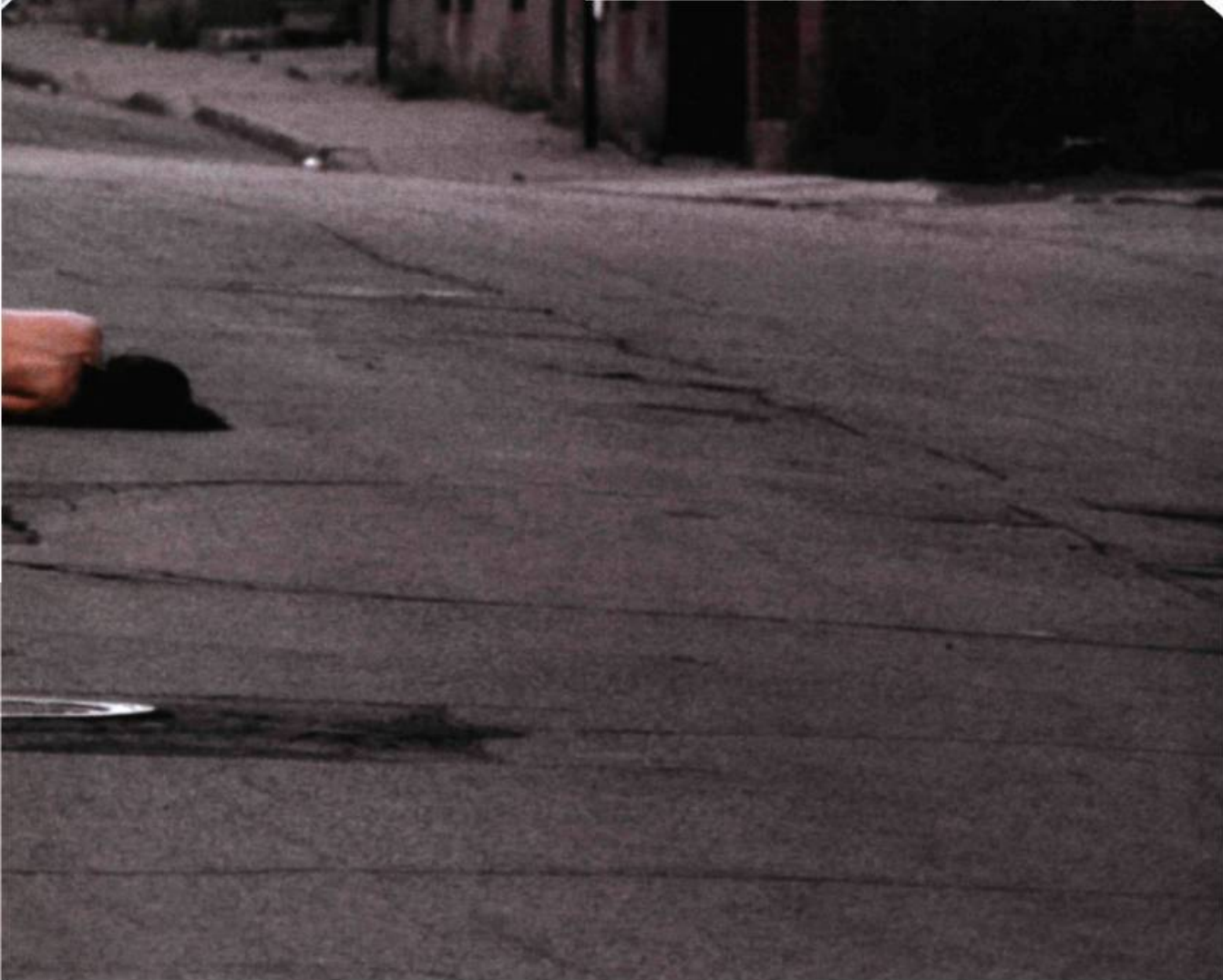
Emmanuelle Léonard, Faits divers , 2004. Photographie couleur; 220 x 172 cm. Galerie Occurrence, Montréal.