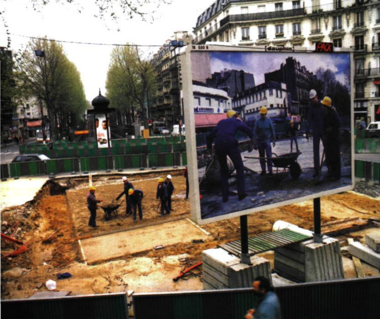
Pierre Huyghe, Chantier Barbès-Rochechouart , Billboard, 1994. Poster impression offset, édition 1/3 x 80 x 120 cm.

temps étiré (propre à la nécessaire perception lente découlant de l'incertitude à propos de ce que l'on voit réellement), tous deux noués pour venir contrer l'idée de stase, de finitude. Ainsi, le chantier est cet espace de l'inachèvement, « mais qui rencontre l'interruption, la fragmentation, le suspend » 5 pour s'achever. Qu'est-ce à dire encore ? Que ce qui l'achève, ce qui renvoie le plus sûrement à ce qu'il est en propre – ce que chantier veut dire – est son propre inachèvement. Dès lors, le chantier, vu ainsi, est un territoire problématique aux frontières incertaines. Il est un problème, car il actualise, à travers ce qui se passe en lui, dans son processus même, un questionnement qui peut être critique par rapport à un réel tout aussi problématique – ou dont il pointe, plus précisément, cet état particulier. Cette actualisation ouvre à un devenir prévisible – le travail fini – certes, mais non uniquement de par ce que l'on sait, mais aussi de par ce que l'on ne sait pas 6 , à travers l'idée d'inachèvement, de non connu encore . C'est donc en refusant de se dire pleinement, à travers son caractère d'incomplétude, que l'idée de chantier renvoie le plus sûrement à l'idée de problème. Pour l'expliquer plus précisément, il nous faut spécifier que le chantier est d'abord un présent en actualisant l'idée d'inachèvement : il est cela même, l'actualisation d'un moment