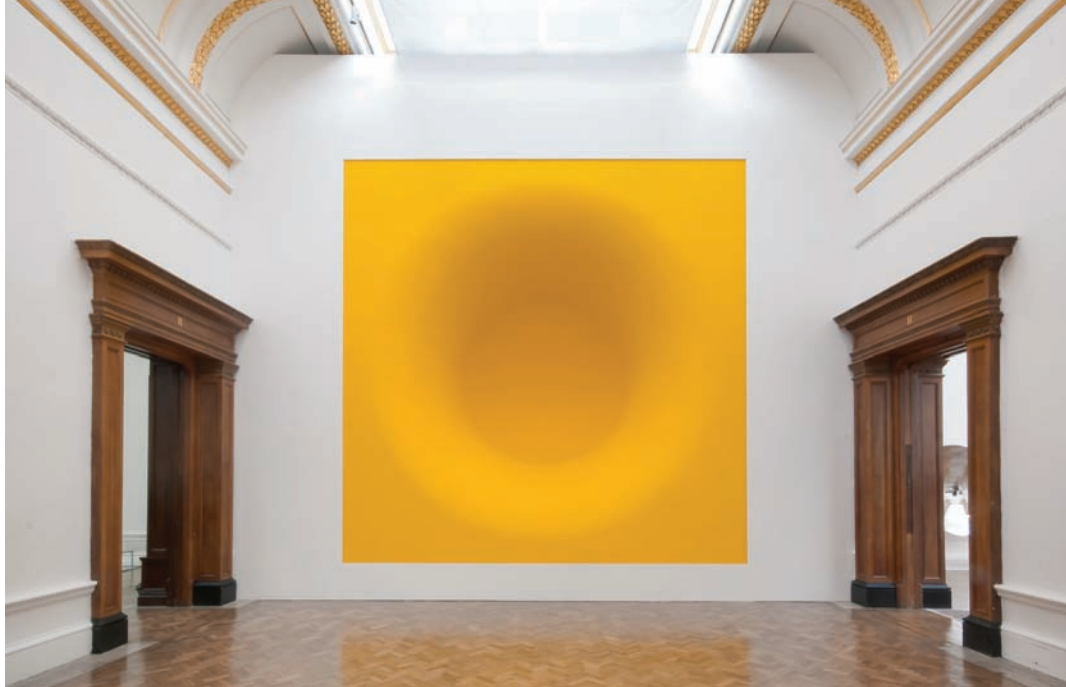
Anish Kapoor, Shooting into the Corner, 2008-2009. Installé à la Royal Academy of Arts, London, 2009. Techniques mixtes ; dimensions variables. MAK, Vienna, Austrian Museum of Applied Arts/Contemporary Art.