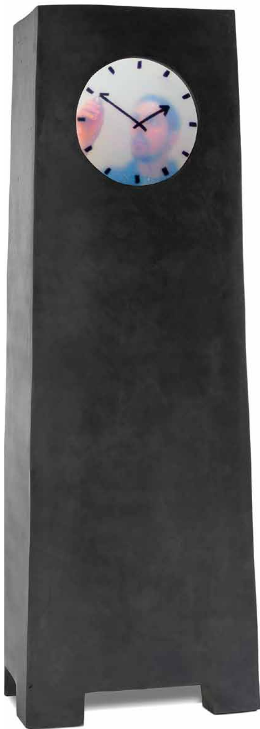
Marten Baas, Black MR Tielmans . Horloge grand-père noire. Collection et avec l'aimable autorisation de l'artiste.

inconsistance narrative, c'est le lâcher-prise vital, le grand retour de la contemplation, et peut-être aussi une pénétration de la mémoire qui donne envie de relire Milan Kundera 14 . Des formes d'authenticité qui passent aussi par la recherche de morceaux d'imaginaire qui, par leur apparente banalité, souvent nous échappent.