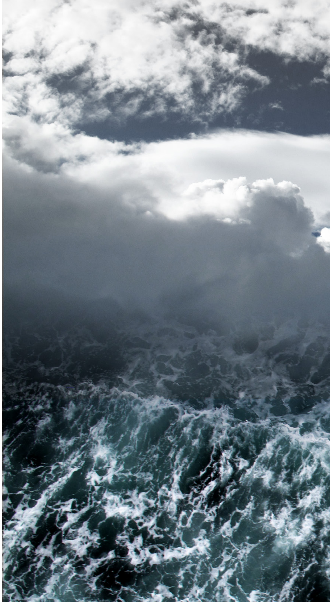
Françoise Tounissoux, Rédemption IV , 2013.