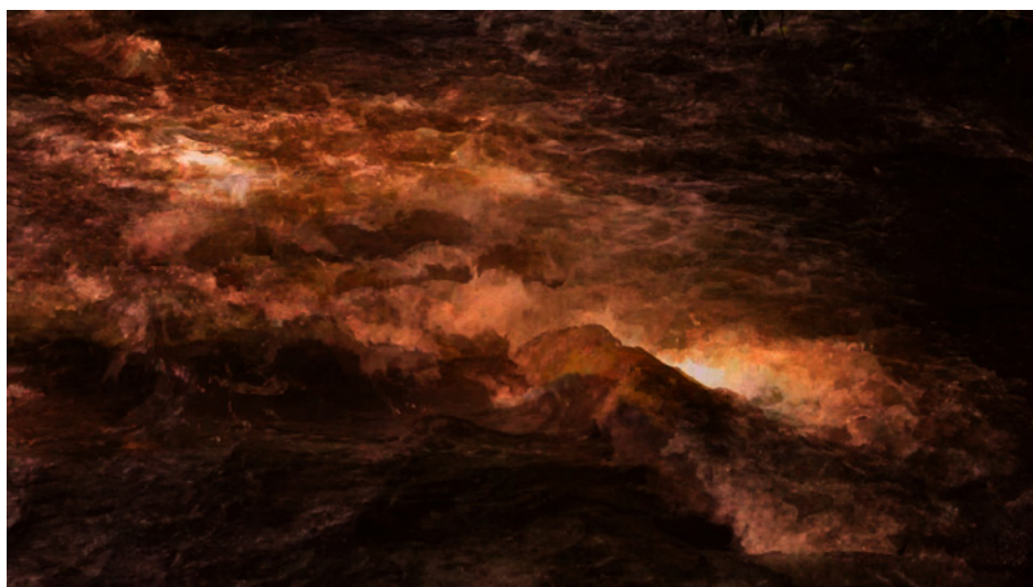
Françoise Tounissoux, Les éléments : l'eau , 2017.