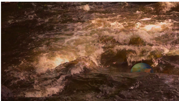
Françoise Tounissoux, Les éléments : l'eau , 2017.