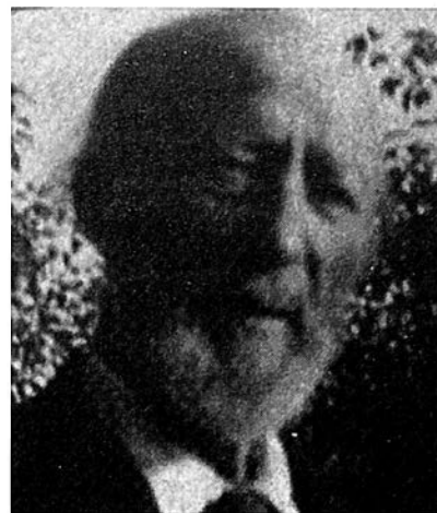
Ozias Leduc en 1954.

les marguilliers, calcul de forfaits après quoi, marché conclu, de longs mois de travail au cours desquels Leduc, dans une forêt d'échafaudages, transposait sur murs et plafonds ses esquisses agrandies au carreau.