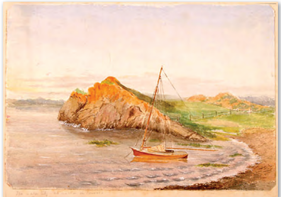
Aquarelle réalisée par Lady Agnes à Rivière-du-Loup. 11

Tous les dimanches, la famille Macdonald se rend à Fraserville pour assister au service à l'église anglicane St. Bartholomew, à laquelle Lady Agnes, tournée vers la religion et l'ascétisme, accorde son patronage pour ses bonnes œuvres. Un fauteuil est