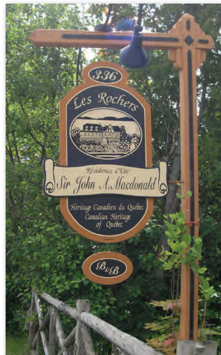
Enseigne du gîte « Les Rochers », résidence d'été de Sir John A. Macdonald, au 336, rue Fraser.

Sur la rue Fraser à St. Patrick, outre John Macdonald au 336, le premier ministre Louis Saint-Laurent a habité au 342, pendant plusieurs étés, de 1950 à 1971. En plus des gouverneurs généraux Lord Monck et Lord Dufferin, Jeanne Sauvé a séjourné au 331. La banlieue ouest de la ville de Rivière-du-Loup peut, à juste titre, revendiquer l'honneur d'avoir été la capitale d'été du Canada.