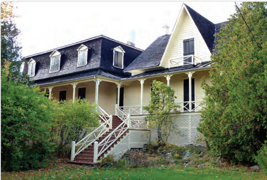
« Les Rochers », résidence sise au 336, rue Fraser, où ont vécu John Alexander Macdonald et sa famille à St. Patrick.