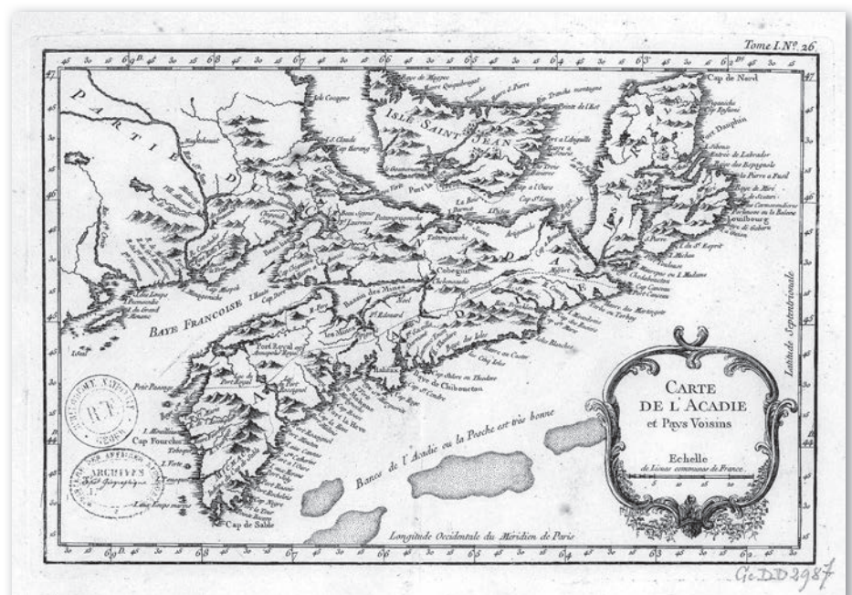
Carte de l'Acadie, Isle Royale, et Pais Voisins... 1757.

La région de Cacouna et de L'Isle-Verte reçoit deux groupes de réfugiés en 1759 et 1763. Le premier arrive de la rivière Saint-Jean, le second de Sainte-Anne (Frédéricton). Le premier groupe quitte Cacouna pour Bécancour au printemps suivant. Les membres du second groupe vont