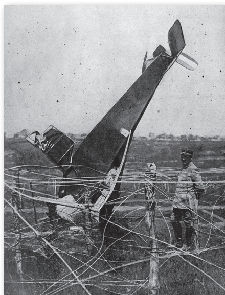
Flachaire et l'avion à bord duquel il a remporté sa première victoire aérienne, en avril 1916.

Un petit groupe de journalistes rencontre Flachaire lors de son arrivée, le 29 mai, à un des grands hôtels montréalais. L'un d'entre eux voit en Flachaire un pilote de chasse français typique : grand, mince, légèrement bronzé, simple, modeste, déterminé et un peu distant. Flachaire semble à l'aise tant en anglais qu'en français. Ses réponses sont brèves, mais il décrit un de ses combats les plus difficiles, au-dessus de Verdun, en 1916. Vétéran de bien des campagnes, l'aviateur souligne que les Alliés ont plus d'avions et de pilotes