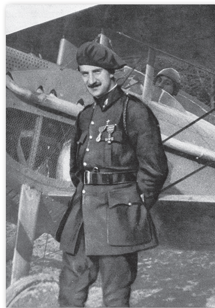
Flachaire, début 1917. La Guerre Aérienne illustrée 1 (19 juillet 1917) : illustration insérée entre les pages 576 et 577.

De retour au terrain du Montreal Polo Club, à Cartierville, non loin de l'hippodrome Blue Bonnets, Flachaire effectue quelques manœuvres au bénéfice d'un petit groupe de personnes présentes. Des représentants du club lui souhaitent la bienvenue. Flachaire prend alors place à bord d'une automobile qui le ramène au parc La Fontaine. Un petit groupe de soldats garde l'avion.