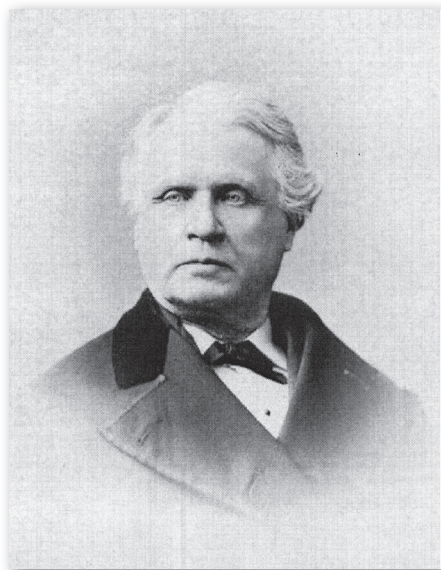
Jean-Charles Chapais (1811-1885). Auteur de l'article intitulé « Le passé, le présent et l'avenir de l'industrie laitière dans la province de Québec », publié dans l'appendice du 25 e rapport de la Société d'industrie laitière de la province de Québec, en guise de témoignage du rôle qu'il a joué dans la modernisation de l'industrie laitière.