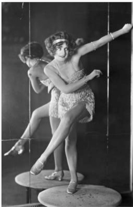
Pas de danse du Charleston.

d'honneur. Ce détail très discret mais pourtant visible depuis la croisée du transept se positionne dans une lecture « raphaélique » de la murale traditionnelle. Nincheri s'inspirait de l'artiste Raphaël, dont Michel Arasse écrit « par sa personnalité et le rôle qu'il joue dans la société romaine du moment, (Raphaël) est un témoin irremplaçable de la complexité vivante de cette situation 5 ».