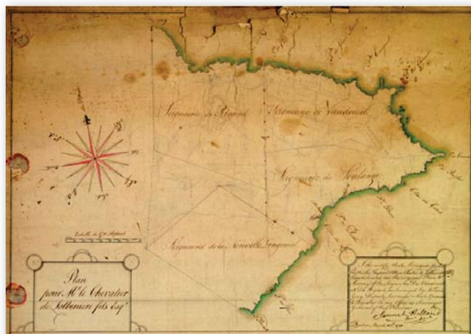
Carte du territoire des seigneuries en 1791.