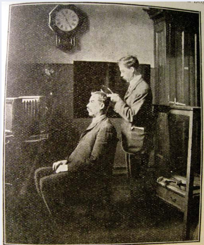
Application du système Bertillon à la Sûreté de Montréal