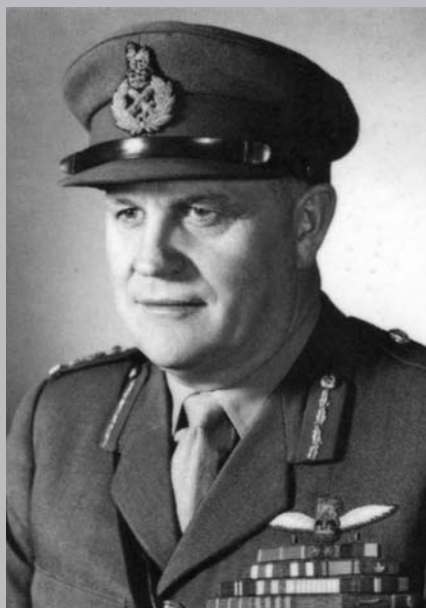
Le général Jean-Victor Allard