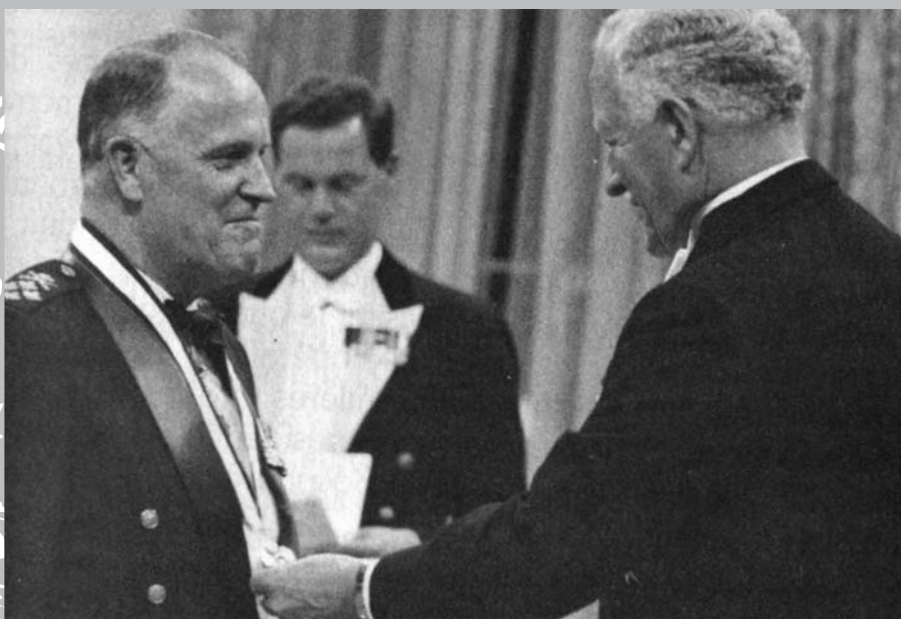
Le 12 novembre 1968, le gouverneur général Roland Michener le fit Compagnon de l'Ordre du Canada. (Source : Bernier, Serge, Mémoires du général Jean-Victor Allard, Ottawa, les Éditions de Mortagne, 1985, 533 pages.)

assuma une seconde fois la fonction de commandant du secteur est du Québec. Son ascension militaire ne s'arrêta pas là. Le 1 er avril 1958, il était promu au grade de major-général. Trois ans plus tard, la reine Élisabeth II approuvait sa nomination au poste de général commandant de la 4 e Division britannique du Rhin en Allemagne de l'Ouest. Il devenait ainsi le premier Canadien à commander une division britannique. Enfin, en 1961, après deux ans en Allemagne, il