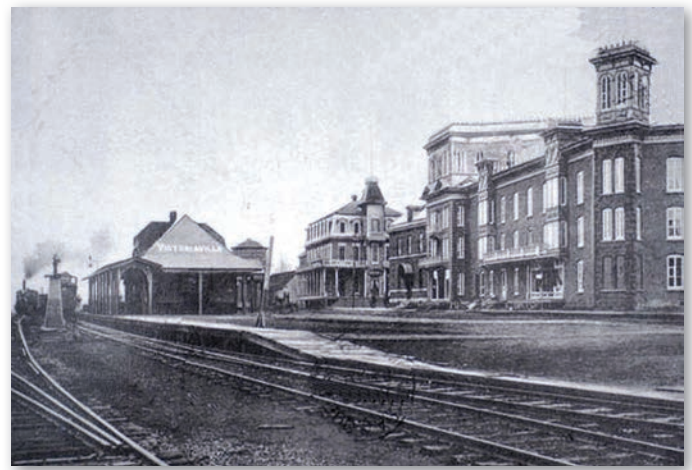
Hôtel Grand Union, 1915.

Deuxième constat. L'alcool faisait tellement partie du débat de nos sociétés que les deux premiers référendums canadien et québécois de l'histoire du pays et de la province, je le répète, les tout premiers référendums nationaux, portèrent sur sa prohibition. Le premier plébiscite canadien eut lieu en 1898 à la demande de Sir Wilfrid Laurier. La première consultation québécoise, sous l'impulsion du premier ministre Lomer Gouin, se fit en 1919. Dans les deux cas, le Québec marqua sa différence par rapport au reste du Canada (que vous appelez le ROC aujourd'hui) en refusant la prohibition à des taux de vote frôlant les 80 %, taux qui feraient l'envie et bien des jaloux aujourd'hui. Après la Première Guerre mondiale, le Québec sera la seule région en Amérique du Nord où l'alcool continuera de couler à flots.