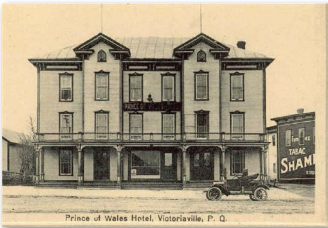
Prince of Wales Hotel, Victoriaville, P. Q.