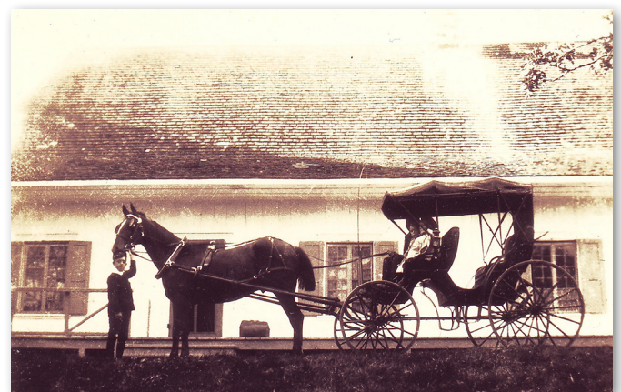
Photo Manoir LaRue 1907 : Charles-Henri LaRue tenant le mors du cheval attelé à la voiture du notaire, vers 1907