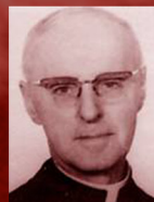
Prix Honorius Provost