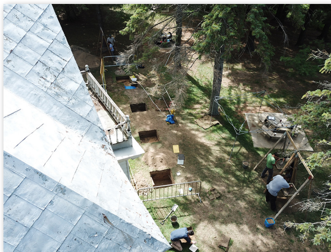
Fouilles archéologiques du presbytère d'Odanak, août 2018.

Si l'archéologie permet de documenter le passé, elle peut aussi servir à documenter les anciens bâtiments, leurs changements à travers le temps et à créer des archives virtuelles pour la transmission aux générations futures.