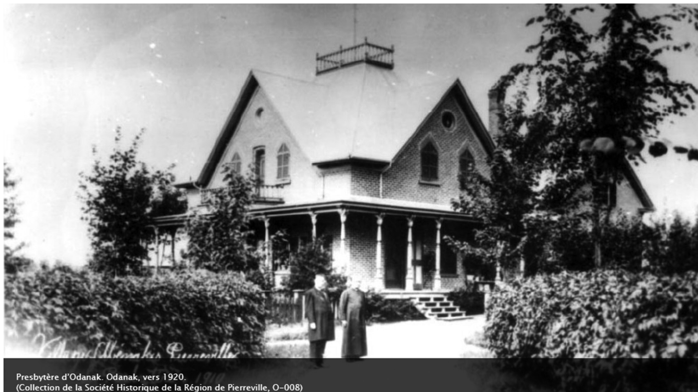
Presbytère d'Odanak. Odanak, vers 1920.

En 2013, la Nation W8banaki s'est dotée du Bureau du Ndakinna, une entité responsable de la gestion des questions territoriales et de la documentation des savoirs et de l'histoire w8banakiak. Il se compose d'une équipe multidisciplinaire spécialisée en anthropologie, en archéologie, en histoire, en biologie, en foresterie et en géomatique. La recherche au Bureau du Ndakinna est entièrement réalisée de concert avec les communautés w8banakiak. Cette approche, qui repose sur le pouvoir décisionnel des Autochtones à monter leurs propres projets de recherche, permet au Bureau du Ndakinna de développer ses capacités de gouvernance, de tenir