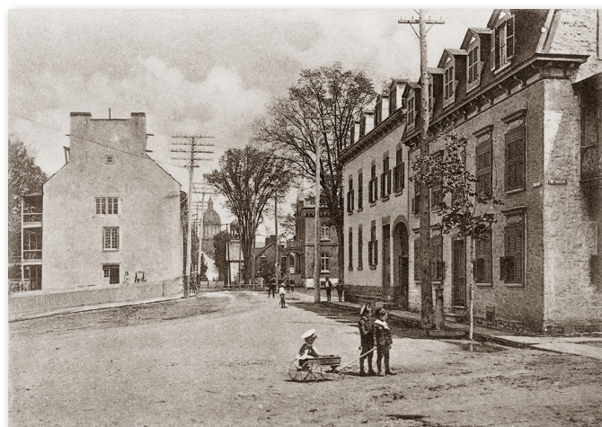
Souvenir de Trois-Rivières.