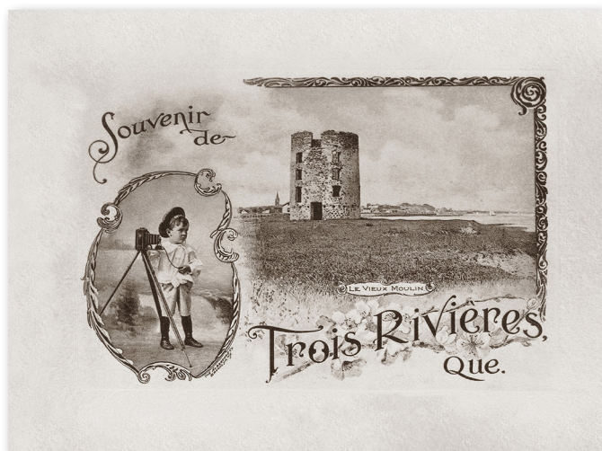
Souvenir de Trois-Rivières.

Il faut certainement rappeler que la période entre 1904 et 1918 est considérée comme l'âge d'or de la carte postale 9 , facilitée par l'efficacité de la poste. Mais ce n'est pas