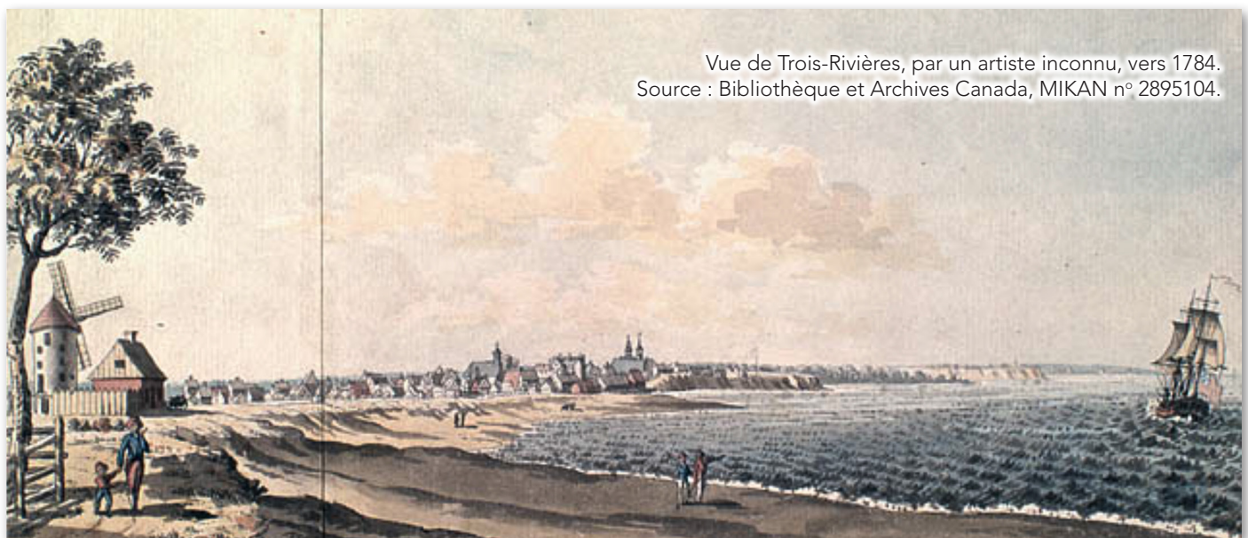
Vue de Trois-Rivières, par un artiste inconnu, vers 1784.

C'est sous l'ordre du gouverneur Vaudreuil que des Acadiens, réfugiés dans la région de Québec, se sont déplacés dans la région de Trois-Rivières et ensuite, dans la région de Montréal.