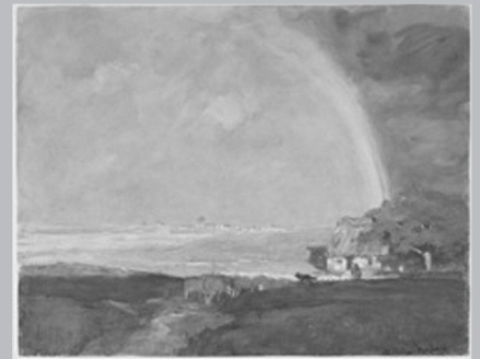
L'Arc-en-ciel, huile sur toile, 1893 (41,7 X 53,8 cm). Horatio Walker exprime la présence des grands espaces et l'importance des phénomènes naturels à l'île d'Orléans.

Après l'établissement permanent des immigrants français, à partir de 1650, trois visions de la nature