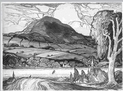
Sainte-Famille, île d'Orléans, 1941, aquarelle et craie noire sur papier, Marc-Aurèle Fortin.

André Biéler habite à l'île d'Orléans de 1927 à 1930. Immigrant suisse, il y retrouve un peu de sa terre natale. Il écrit qu'à l'île, « tout me semble agréable, le climat, les gens, et par-dessus tout le paysage qui, de tous les points de vue, est le plus beau que j'ai vu au Canada » 3 . Biéler s'intéresse aux activités quotidiennes de ses habitants encore marquées par les traditions mais déjà influencées par le progrès. L'environnement naturel occupe une grande place dans son œuvre. À l'île d'Orléans, comme dans les nombreuses scènes de campagne qui composent la plus