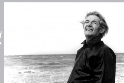
Félix Leclerc à l'île d'Orléans, vers 1975.

Le tourisme est devenu la seconde activité économique en importance à l'île d'Orléans. Les fers de lance de cette industrie sont le riche patrimoine historique, la variété des produits agroalimentaires de qualité et la beauté naturelle des paysages. On peut lire dans la Politique patrimoniale et culturelle de l'île d'Orléans , promulguée en 2005 dans le but de mieux conjuguer traditions et développement, que les paysages « forment à eux seuls une ressource patrimoniale exceptionnelle et comptent parmi les plus pittoresques et les plus recherchés du territoire québécois » 5 . Les dizaines d'artistes