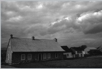
Maison ancestrale du régime français à Saint-Pierre, île d'Orléans.

générosité des ressources naturelles. Puis on a remarqué l'harmonie qui régnait entre ce grand potentiel et les habitants de l'île qui, en grande majorité, pratiquaient l'agriculture. Enfin, le charme de ses paysages n'a fait qu'ajouter une autre valeur à tout cet équilibre.