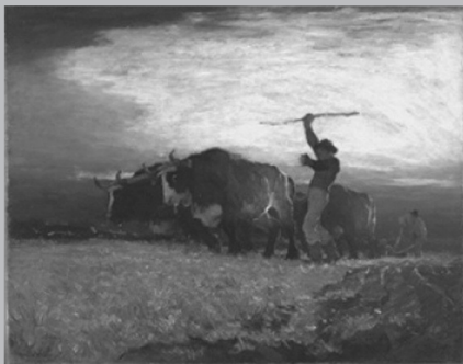
Labour aux premières lueurs du jour, Horatio Walker, huile sur toile, 1900 (153 X 193,4), l'un des premiers chefs d'œuvre d'Horatio Walker. Exposée pour la première fois en 1900, cette toile a valu à l'artiste une réputation internationale. Musée national des beaux-arts du Québec. Achat en 1929, restauration effectuée par le Centre de conservation du Québec.

Au temps de la Nouvelle-France et jusqu'au milieu du XIX e siècle, on a décrit à maintes reprises les abondantes ressources alimentaires dont jouissait la popula-