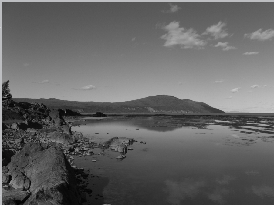
La pointe est de l'île d'Orléans, ou pointe d'Argentenay. (Source : Martin Fournier)

Au fur et à mesure que progresse le xx e siècle, la beauté naturelle de l'île d'Orléans séduit de plus en plus, alors que l'intérêt pour le mode de vie traditionnel s'estompe.