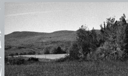
Récolte d'automne à Saint-Pierre, île d'Orléans.

qui y ont élu domicile ces vingt dernières années témoignent de la valeur toujours actuelle de cette île ensorceleuse comme source d'inspiration.