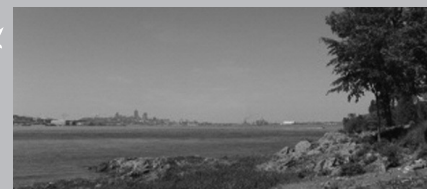
La pointe ouest de l'île d'Orléans.