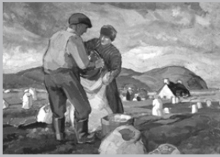
Les patates, Argentenay, huile sur toile, André Biéler.