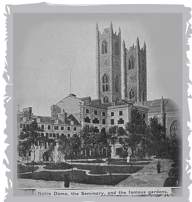
Notre Dame, the Seminary, and the famous gardens.