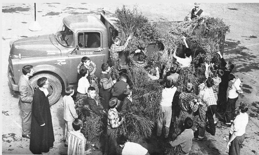
Éradication de l'herbe à poux par un cercle de jeunes à Montréal, circa 1955.

Dans les années 1980, les CJN réalisent des outils d'animation au goût du jour : la série de cahiers d'activités Le Naturaliste , une série de diaporamas sur les écosystèmes québécois, des logiciels d'identification des arbres, des insectes et des roches, le guide de sensibilisation aux sciences naturelles, la série l'Évolution et Les Ateliers , une brochure présentant aux animateurs des jeux à réaliser avec les jeunes sur différents thèmes des sciences naturelles. En 1981, c'est aussi le 50 e anniversaire des CJN. L'implantation d'un programme de sciences de la nature