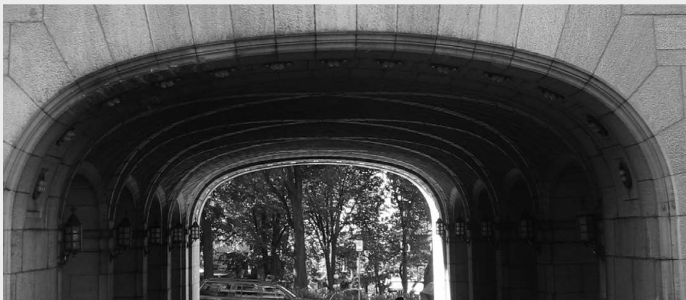
Intérieur de l'une des deux portes cochères du château Frontenac.

A-t-il voulu faire du fort-château Saint-Louis une forteresse de ce même Ordre? Possible également... C'est en effet l'une des hypothèses envisagées pour expliquer son rappel en France 5 .