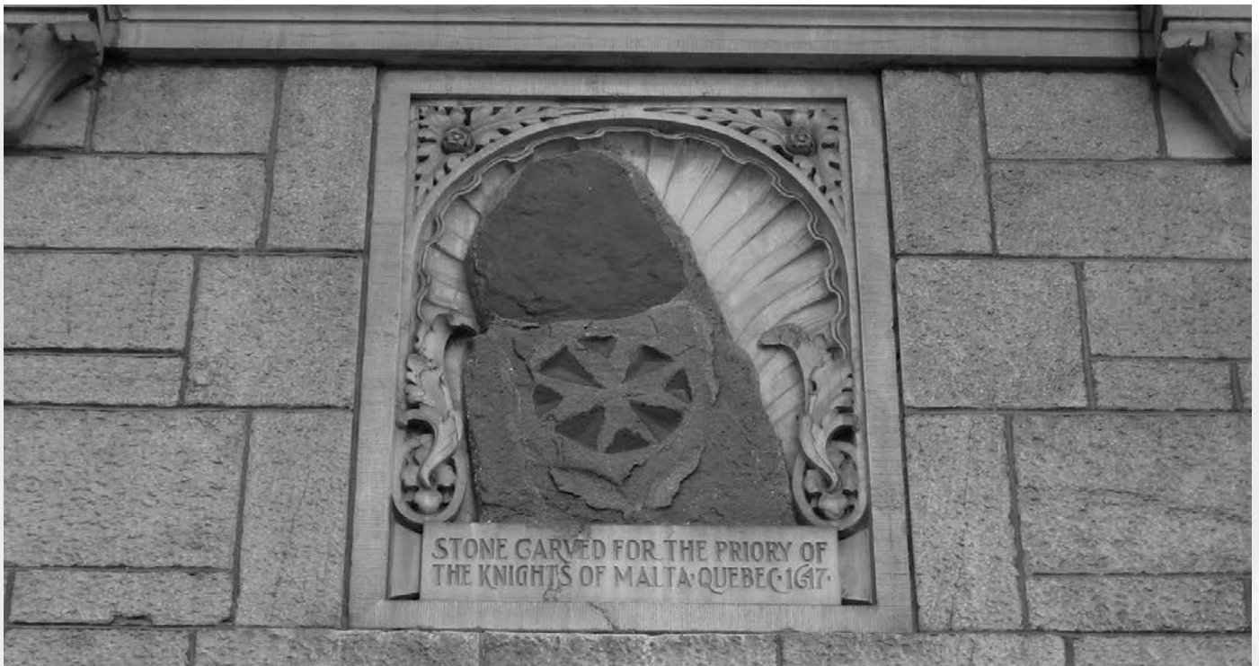
Sur la partie supérieure de l'une des portes cochères du château Frontenac, châsse renfermant la pierre du premier château Saint-Louis.