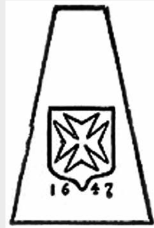
La pierre du premier château Saint-Louis.

La comparaison de l'illustration de Gagnon avec la photo prise récemment par l'auteur du présent article laisse voir de façon très évidente qu'il manque la partie inférieure de la pierre, celle mentionnant le millésime. Le texte de la plaque de bronze fixée à la porte cochère aujourd'hui ne fait cependant aucun doute sur l'origine de la petite sculpture. On y lit en effet qu' au-dessus de cette porte cochère se trouve la pierre de la croix de Malte. En 1647, Charles Huault de Montmagny, chevalier de l'ordre de Malte, premier gouverneur et lieutenant général de la Nouvelle-France la fait placer sur le château Saint-Louis.