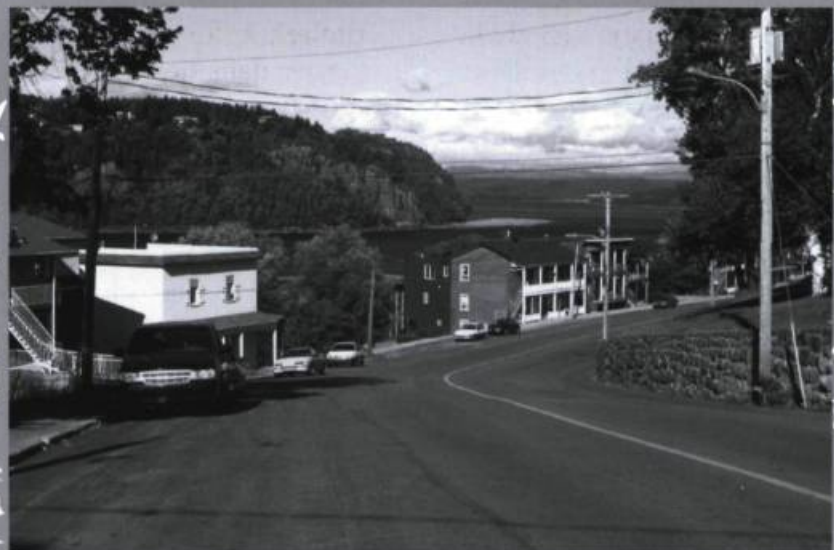
Le profil des maisons de la rue Racine, le cap Saint-François et la rivière Saguenay forment un ensemble qui a su conserver son caractère au fil des ans.