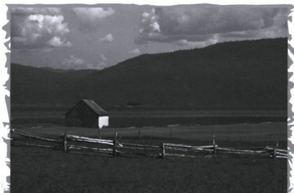
Les terres agricoles rehaussent l'esthétique des paysages de l'Anse-Saint-Jean. Ici, une vue magnifique sur la plaine avec en arrière-plan le fjord du Saguenay.

la problématique pourrait suffire à écarter d'emblée la notion de paysage patrimonial. Pourtant, si l'on reconnaît l'importance et la persistance de la demande sociale, il est difficile de ne pas intégrer le paysage comme une nouvelle catégorie de patrimoine. C'est la position que tendent à adopter de plus en plus d'acteurs, depuis la Commission Arpin jusqu'à la Ville de Montréal, en passant par de nombreuses associations. Dans la suite d'une telle reconnaissance, la