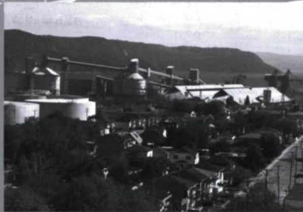
Les activités humaines, quelles qu'elles soient, façonnent continuellement le paysage. Chacun à leur manière, le développement de l'agriculture et l'industrialisation structurent l'utilisation du territoire.

des décisions retenues face à de grands enjeux de société (ex. : zones de territoires protégés). L'exercice a permis de révéler l'existence d'une grande diversité de paysages dans la région. De même, il a souligné comment ces paysages se transforment constamment, sous l'impulsion des dynamiques socioculturelles, économiques, politiques et écologiques.