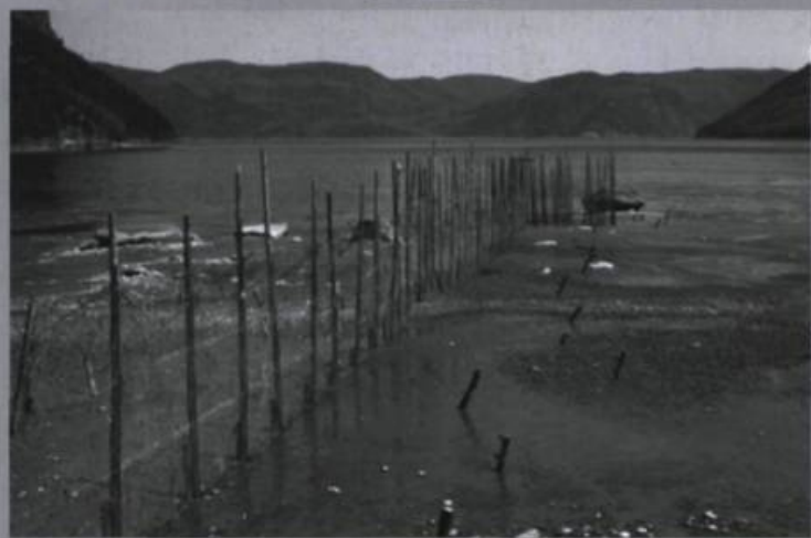
Il y a quelques décennies, les trappes à poissons constituaient un élément représentatif des paysages de la rivière Saguenay.

La thématique du paysage ne s'impose pas comme une évidence pour un organisme comme le Conseil du loisir scientifique (CLS). Pourtant, grâce à l'intérêt que sa présidente et son directeur général portent à cette thématique, des ressources y ont été consacrées dès 1998. La question du paysage s'inscrit désormais dans le plan triennal du CLS, comme un champ de spécialisation du tourisme scientifique et de production de la connaissance citoyenne. La démarche peut être décomposée en quatre grandes étapes.