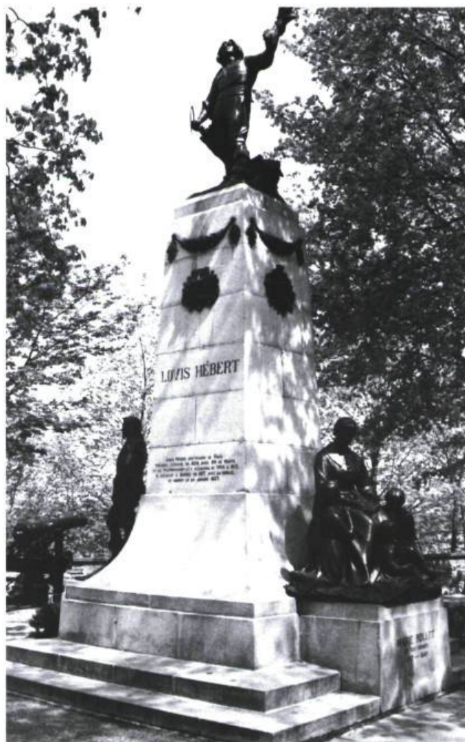
La statue de Louis Hébert, à Québec.