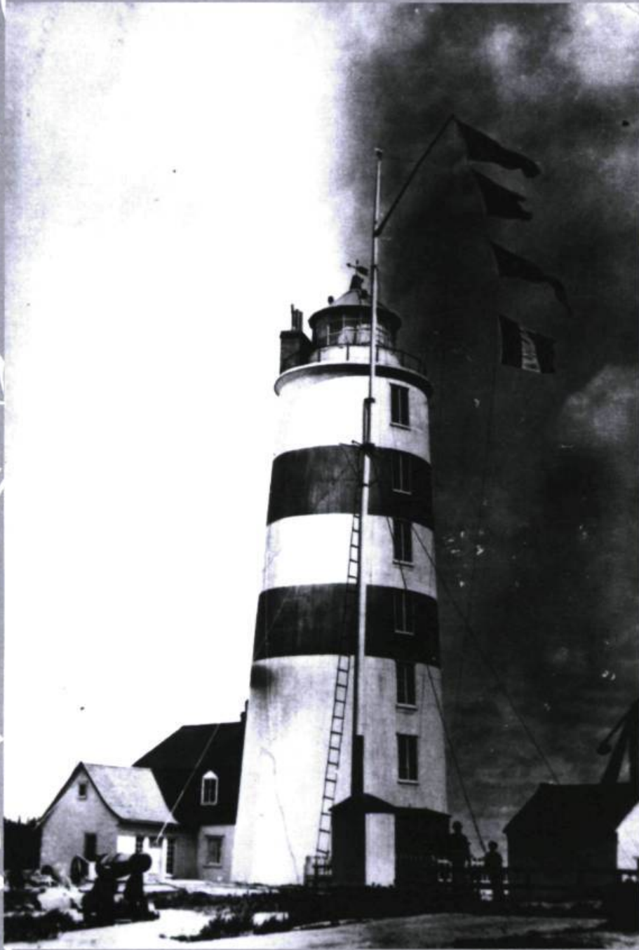
Le Phare de Pointe-des-Monts en 1905.