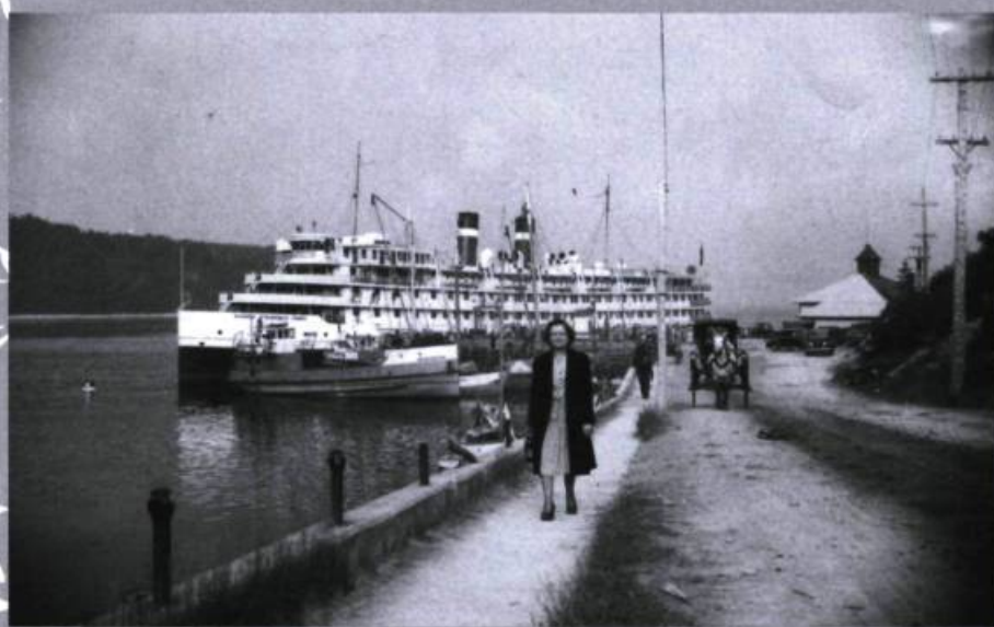
Bateau de croisière de la Canada Steamship Lines au quai de Tadoussac.

et toute la campagne environnante. La perspective d'une journée ensoleillée sema l'enthousiasme à bord. S'y étaient retrouvés : quelques touristes de New York, plusieurs prêtres dans leurs longues soutanes noires et des élèves en uniforme du Séminaire de Québec partis passer leurs vacances d'été à la maison, trois ou quatre religieuses en voyage vers le bas du fleuve, un ecclésiastique protestant venu d'Ottawa, un avocat de Montréal et sa famille, le seigneur de