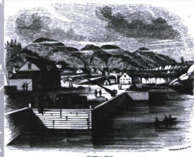
Croquis de Lossing-Barritt présentant l'Anse-à-l'eau, Tadoussac.