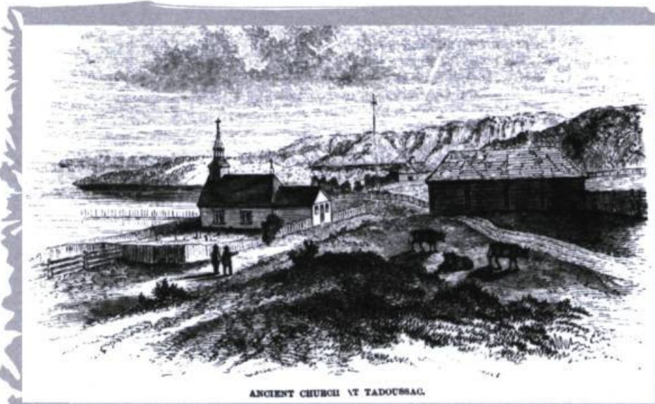
ANCIENNE CHURCH ET TADOUSSAC.

apprécié mon dessin de la baie et du plateau, avec ses filets au second plan, qu'il me fit don d'une magnifique truite de mer toute fraîche qui nous permit, à trois, de déjeuner le matin suivant. Le dessin de la vieille chapelle nous fait d'ailleurs voir la plage où se pratique la pêche, ainsi que le promontoire rocheux de l'islet qui sépare la baie de Tadoussac et les eaux sombres du Saguenay avec ses rives montagneuses. Tadoussac est à 130 milles de Québec. Depuis la fondation de la Compagnie de la Baie d'Hudson, voilà plus d'un siècle et demi, l'endroit demeure un poste de traite de cette compagnie où résident un des associés et un agent 2 . Ils ont là une jolie demeure d'un étage et les quelques bâtiments d'appoint nécessaires au commerce, une place du drapeau flanquée de deux