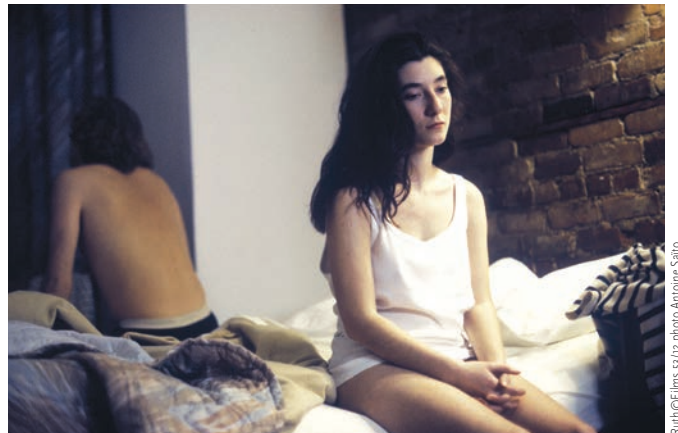
Ruth©Films 53/12 photo Antoine Saito

Avant Beebe-Plain , Delisle réalise deux courts métrages, dont « La mer on s'en fout! », qui rappelle autant le courant post-dadaïste (notamment par sa fin dans laquelle les deux marins d'eau douce « naviguent » au cœur de Montréal) que Les carabiniers de Godard (la présence du texte manuscrit, le caractère distancié de l'action). On est là au milieu d'une fantaisie absurde qui trouve sa source dans un réel sans horizon, les personnages étant comme des poissons dans un aquarium (ce qu'illustre littéralement Delisle). Du couteau au fusil , son deuxième court métrage réalisé juste avant Beebe-Plain , se présente plutôt comme la chronique réaliste mais fragmentée