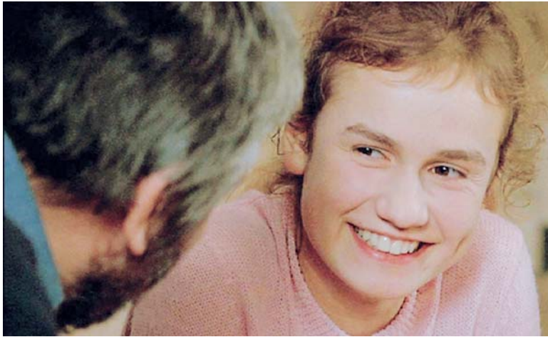
Sandrine Bonnaire dans À NOS AMOURS (1983)

et un peu bavarde est en fait un tour de force. Pialat n'a jamais cédé à la tyrannie de la logique de la fiction traditionnelle, et ne sert au contraire que celle de la vie. La logique sans logique de la vie. Comme Tarkovski s'est baladé avec aisance et à sa façon avec celle du rêve et de la mémoire dans Le miroir . Voilà toute la différence. Il s'agit sans doute de l'un des plus beaux films sur l'adolescence, et sans doute de l'un des portraits les plus justes et vrais d'une jeune fille post-révolution sexuelle. Ceux et celles croyant qu'un homme d'un certain âge (Pialat avait 58 ans) ne peut réaliser un film sur une jeune fille sans sombrer dans une forme de complaisance secrètement libidineuse peuvent aller se rhabiller. À nos amours ne se limite pas qu'à la découverte d'une actrice d'exception dont le miracle de la performance ne se reproduira plus. Je me corrige tout de suite: il n'y pas de performance dans le jeu des acteurs chez Pialat. C'est une présence vivante, jamais exagérée ni poussée, on n'a pas besoin d'enflures quand on est capable d'insuffler à ses acteurs la grâce de n'être que vivant, alerte, spontané, fébrile, sur le qui-vive de l'inattendu. Jamais Bonnaire et Depardieu n'ont été aussi naturels et vivants que chez Maurice Pialat.