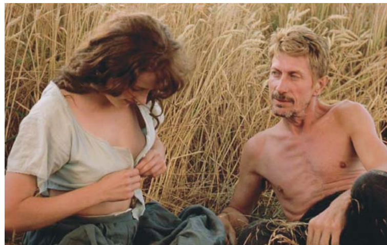
MES PETITES AMOUREUSES (1973) de Jean Eustache et VAN GOGH (1991) de Maurice Pialat