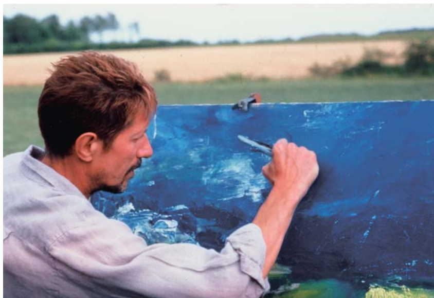
Jacques Dutronc dans VAN GOGH (1991)

La Grande Guerre. La campagne paisible et la vie quotidienne. On prend des nouvelles du front, on prend part à la vie du village : baignades, pique-niques, fêtes foraines... Certains partent pour le front et ne reviennent pas. Un couple bon, généreux, s'occupe d'enfants en pension chez eux. Des enfants de Paris, privilégiés, réfugiés à cause de la guerre dont Hervé, protagoniste auquel on se lie au fil des sept épisodes. Mais les enfants finissent par repartir. On se sent alors abandonné aussi comme spectateur, comme ce couple, par la présence de ces enfants auxquels nous nous sommes aussi attachés... L'impressionnisme du peintre Pialat rencontre ici quelque chose de proustien. Une œuvre sans pareille. Et pourtant, E.T. nous avait aussi abandonnés, comme presque tous les membres attachants de la famille Corleone : le père, Sonny, Fredo... Mais chez Pialat, les rebondissements dramatiques sont absents, la mécanique narrative est dissoute, il ne reste plus que quelque chose d'un