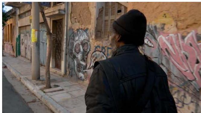
Combat au bout de la nuit

Les femmes de ménage ont été mises à pied en septembre 2013. Au moment où je les ai rencontrées, elles avaient déjà fait beaucoup d'actions, mais leur occupation du ministère des Finances date de mai 2014, un mois avant mon second voyage. Cette occupation les rendait tout à coup beaucoup plus visibles. Ce qui m'avait amené en Grèce, c'était le désir d'accompagner les gens en lutte. Or en 2014, l'état d'esprit qui régnait était dépressif, il ne se passait presque plus rien dans la rue, les actions étaient plutôt souterraines. Tout le monde s'était replié après avoir lutté et s'être fait « gazer », mais aussi après avoir fait face à la justice pendant plusieurs années. Les femmes de ménage, elles, ont décidé de sortir sur la place publique alors que personne ne s'y attendait. Au moment de leur congédiement, ces 595 femmes n'étaient pas syndiquées, elles pratiquaient un métier peu estimé et constituaient une population marginalisée, ce qui fait que le gouvernement pensait que leur licenciement passerait inaperçu.