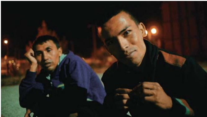
Combat au bout de la nuit