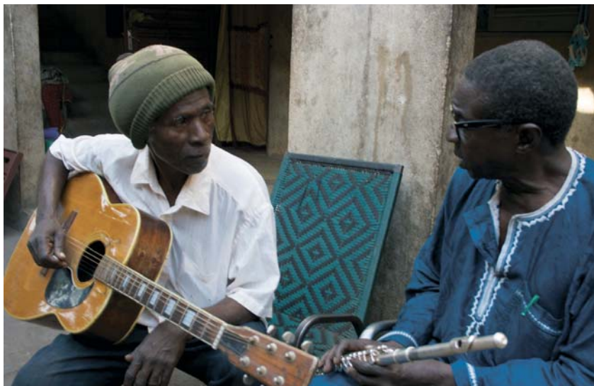
Bamako temps suspendu (2014)

et fait un premier montage de ce matériel sans jamais être « en production ». J'étais plongé dans un état de fièvre encore difficile pour moi à mesurer. C'est là que je vois un point de rupture dans mon travail. Bamako temps suspendu , c'est complètement différent, même si quelque chose de ce que j'ai expérimenté pendant le printemps 2012, qui tient à la présence des choses et des êtres, m'a accompagné dans ce film. Au moment où j'ai filmé ces musiciens, le Nord du Mali était en guerre. Les islamistes interdisaient la musique à Tombouctou, et le gouvernement les manifestations publiques à Bamako. Ce film est venu vers moi comme un moment de joie arraché à la guerre.