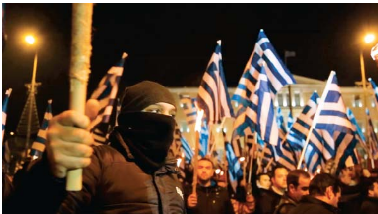
Combat au bout de la nuit

L'idée d'assumer seul le montage s'est imposée au fur et à mesure, parce que je retournais dans la salle de montage entre chaque voyage. Après l'élection de Syriza, compte tenu des événements qui se bouscuaient de façon imprévisible, il fallait que je puisse partir dès que j'en sentais la nécessité, et revenir pour monter tout ça à chaud, le plus rapidement possible. Cet exercice a été très libérateur pour moi. Au moment du référendum que personne n'attendait, j'ai quitté la salle de montage le vendredi et le lundi, j'étais en Grèce. J'y suis resté trois semaines et deux jours après mon retour à Montréal, j'étais de nouveau en montage. Il y a donc eu une circulation constante entre montage et tournage, ce qui fait que je ne quittais jamais le film. Dans le cas de mes films précédents, il y avait toujours une longue période d'attente entre le tournage et le montage, période pendant laquelle il me semblait perdre la motivation première du film. Avec Sur le rivage du monde , j'ai commencé à explorer le montage par étapes, à faire une partie du montage après chaque tournage. Aujourd'hui, c'est devenu une méthode de travail qui me permet de sentir le film alors qu'il prend forme. Je suis quelqu'un de lent. Le fait d'être constamment dans le processus de fabrication du film vient contrer ma lenteur naturelle et me permet d'être toujours dans l'énergie de la création.