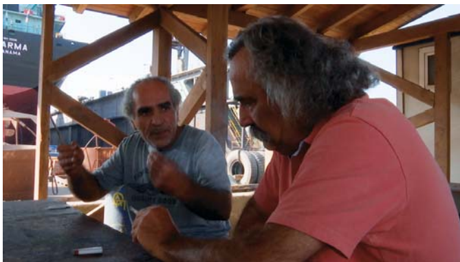
Combat au bout de la nuit (2016)

Sud ne pourrait que se propager tôt au tard vers le Nord. Il y a un espace commun en Méditerranée qui fait que les choses circulent. Comme mon film précédent, Sur le rivage du monde , a un peu voyagé, cela m'a permis d'aller à Lampedusa, à Gênes, à Marseille. Mais en arrivant à Athènes, j'ai immédiatement senti que le film devait se passer là. J'y ai rencontré non seulement des Grecs en lutte, mais aussi des Syriens, des Palestiniens, des Égyptiens, des Camerounais, des Algériens. Dans la même journée, je passais d'un groupe à l'autre, tout naturellement. Ils étaient là, dans les rues, au hasard de mes déambulations. Je côtoyais des Grecs qui venaient à la défense des migrants, des réfugiés et tous se retrouvaient dans les mêmes lieux : ces espaces s'entremêlaient.