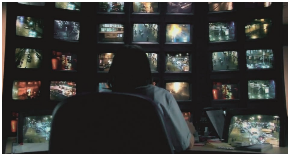
Red Road (2006)

Opératrice de caméras de surveillance, Jackie assume immédiatement la position de voyeuse. Après avoir reconnu Clyde sur l'un des écrans où s'étalent les rues froides et bétonnées de Glasgow, c'est elle qui chasse, qui épie, qui traque l'homme-proie. Le personnage s'affirme comme une déesse souterraine, solitaire, travaillant la nuit, dans l'antre d'une pièce obscure qui, en plus de l'exclure du monde des vivants comme un vampire, la maintient dans la noirceur métaphorique d'un deuil impossible. Si l'on ne sait pas de prime abord de quoi il en retourne exactement, Arnold