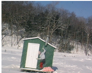
[1-2] Bonbons bijoux (1996) et [3-4] Oh là là du narratif (1997)

Nous avons besoin (je lance ici un avis de recherche) des enfants des Shadoks pour nous sauver des eaux glacées du calcul égoïste (Marx) qui ont fini par réchauffer dramatiquement notre planète. Des sortes de sous-commandant Marcos de l'art vidéo qui auraient des raisonnements mathépoétiques shadokiens de ce genre : « Où l'on expliquera pourquoi les comptes ne tombent pas juste et où l'on démontrera que la somme et la soustraction n'ont d'utilité que si elles servent à additionner les espoirs et soustraire le cynisme ». Des humains qui ne seraient pas à plaindre selon la définition qu'en donne Michel Leiris : « Je plains les hommes qui n'ont pas rêvé, au moins une fois dans leur vie, de se changer en l'un quelconque des divers objets qui les entourent : table, chaise, animal, tronc d'arbre, feuille de papier. Ils n'ont aucun désir de sortir de leur peau, et ce contentement paisible, troublé par nulle curiosité, est un signe tangible de cette insupportable suffisance qui est l'apanage le plus clair de la plupart des hommes ».