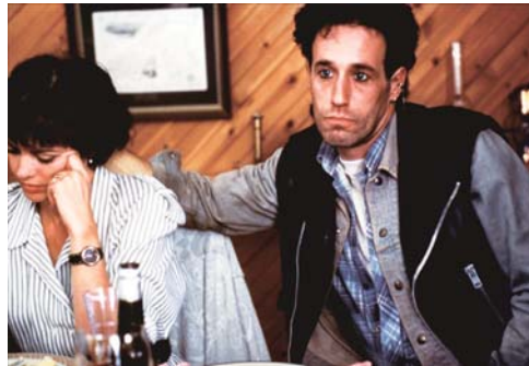
Le déclin de l'empire américain

l'ordonnement, la juxtaposition des scènes. On a recherché un effet beaucoup plus clippé, avec les deux masturbations qui se répondent au début, par exemple.