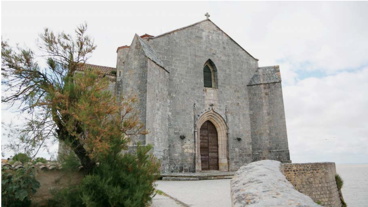
Église romane de Saintonge

A u début d'un de ses plus beaux textes, paru en septembre 1947 dans la revue L'Écran français à propos du film d'archives sur le Paris de la Belle époque réalisé par Nicole Vedrès avec l'assistance d'un certain Alain Resnais, André Bazin s'exclame: «J'apprécie ce soir le bonheur de n'être pas metteur en scène, car je n'oserai plus toucher une caméra après avoir vu Paris 1900 .» Le texte s'intitulait, justement: «À la recherche du temps perdu». Cette première phrase a été soustraite, dix ans plus tard, de la version que l'on peut découvrir dans le premier volume (si on le trouve) de Qu'est-ce que le cinéma? dont Bazin supervisa de près l'édition (les trois autres volumes furent édités après sa mort). Ce premier tome sortit à l'automne 1958, aux Éditions du Cerf, exactement deux semaines après que Bazin, à 40 ans, succombe à une leucémie le 11 novembre 1958, le lendemain du premier coup de manivelle des 400 coups de Truffaut (comment ne pas ressentir un frisson, à chaque fois, à l'évocation de cette funeste coïncidence).